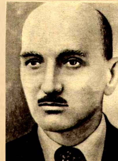
Созрыко Аузбиевич Бритаев (1892-1961)