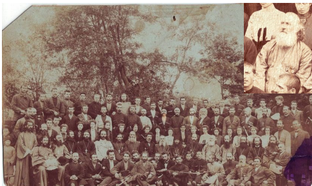
Съезд учителей Ардонского отделения Владикавказского епархиального училища и попечительского совета. 1903.

веди оказывали сильное эмоциональное воздействие на прихожан. По свидетельству многих современников, отец Алексей Гатуев был выдающимся духовным оратором. Самоотверженными усилиями талантливый проповедник удержал горную Дигорию на позициях православной веры. В 1883 г. за обращение в православие 163 мусульман Алексей был награжден орденом св. Анны III степени. Всего же за время своего пастырства он обратил в православие более 300 мусульман.