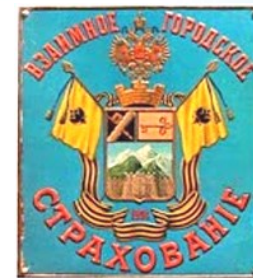
ИСТОРИЧЕСКИЙ ГЕРБ ВЛАДИКАВКАЗА 1873 г.