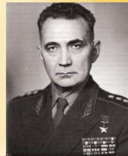
Хаджиумар Джиорович Мамсуров (1903-1968)