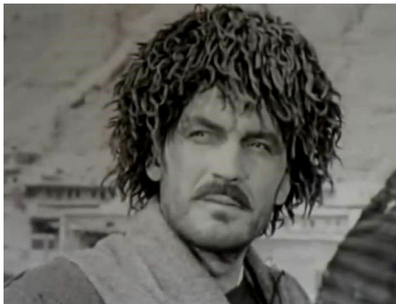
Владимир Тхапсаев "Так рождается песня" (1957)

Молодой Тхапсаев, прежде чем стать актером, был шахтером в Садоне, строил Гизельдон ГЭС, работал на Сахалине, в Комсомольске – на Амуре, однако жил все эти годы мечтой о театре. Ему было 12 лет, когда он впервые увидел любительский спектакль «Две сестры» в родном Ардоне и тогда уже у него появилась мечта стать актером. Он работал в театре рабочим сцены, одновременно учился в Осетинской театральной студии, участвовал в массовках, исполнял небольшие роли без слов. Но однажды судьба улыбнулась ему: заболел актер, исполнявший ведущую роль и Тхапсаев его заменил. Сыграл... и победил. Образ Бартолена в «Адвокате Патлен» получился у молодого актера ярким, запоминающимся... Затем последовали новые и новые роли. Вскоре он был занят почти во всех спектаклях. И пошли годы постоянной, кропотливой, самоотверженной работы.