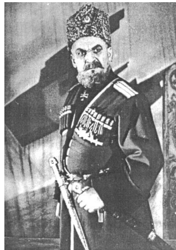
Владимир Тхапсаев в спектакле "Сармат и его сыновья"(1967)

За ролью «Отелло» - одной из труднейших ролей мирового репертуара последовали Тхапсаев-Лир («Король Лир»), Тхапсаев – Макбет («Макбет») и другие. И везде глубокое проникновение в образ,