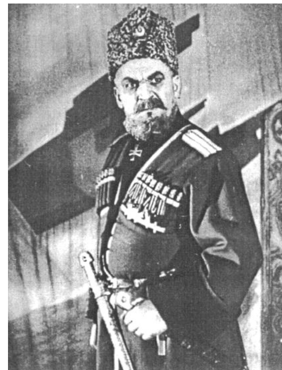
Владимир Тхапсаев в спектакле "Сармат и его сыновья"(1967)

Тхапсаев по праву считался одним из лучших исполнителей роли Отелло в мире. Именно в этой роли он раскрыл себя как крупный, талантливый актер трагического плана и заявил о новых своих возможностях.