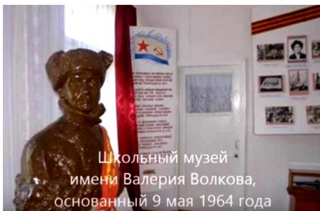
Школьный музей имени Валерия Волкова, основанный 9 мая 1964 года

9 мая 1964 года в Севастопольской школе, которую обороняла «непобедимая десятка», был открыт музей юного защитника города.